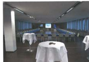
Tagen am Flughafen Innsbruck

triebsrestaurant genutzt oder ein Cateringservice angefordert werden.