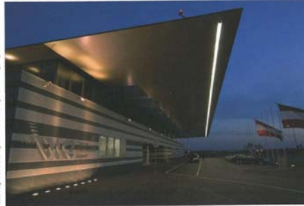
Tagunglocation Flughafen Wien

Zur Effizienzsteigerung von Geschäftstreffen die eine Flugreise beinhalten, bietet sich das Meeting direkt am Flughafen an. Viele Airports oder airportnahe Hotels halten gut ausgestattete Business-, Tagungs- oder Konferenzräumlichkeiten bereit und helfen so Zeit und Geld zu sparen. Ein Überblick über Möglichkeiten in Österreich und Deutschland.