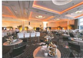
Gesetztes Dinner im Kempinski Hotel Airport München

Berlin-Schönefeld: Am Berliner Flughafen Schönefeld im Süden der Stadt gibt es am Terminal A eine Besprechungslounge für maximal zwölf Personen. Das Catering wird je nach Bedarf von Mövenpick organisiert, technische Gerätschaften werden nicht zur Verfügung gestellt. Das Konferenzzentrum Flughafen Berlin-Schönefeld GmbH präsentiert sieben Räume, eingerichtet für zehn bis 300 Personen. Alle Zimmer sind mit Overheadprojektor und Flipchart ausgestattet und werden auf Wunsch mit Audio- und Video-Equipment, Mikrofonanlage, Telefon und Faxgerät ergänzt. Für die Verpflegung kann das Be-