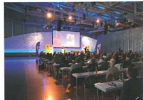
Großveranstaltung in Salzburg